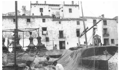
▲ Llaüt de farols al carrer de Sant Pere, 1940. Arxiu personal Luis Fuster i Orts.