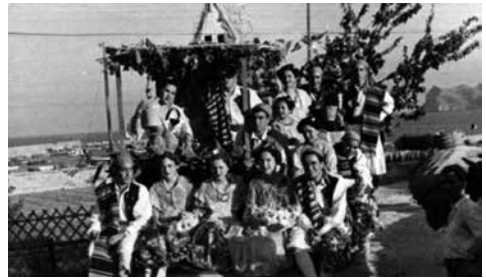
▲ Les carrosses, anys 50.