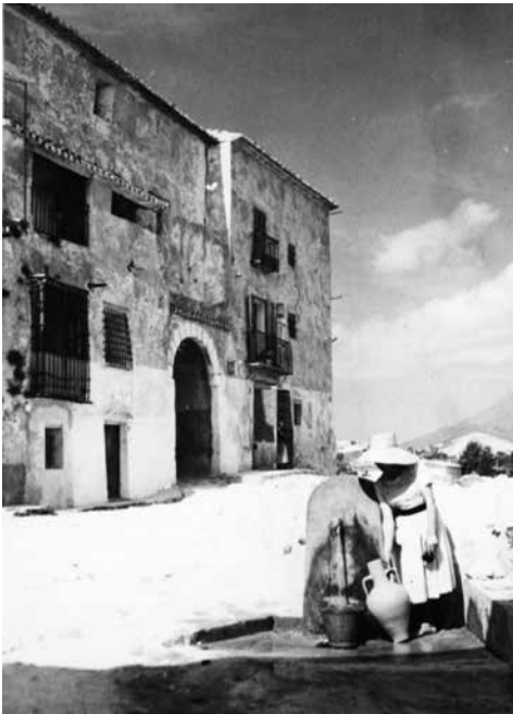
▲ Plaça del Portal Vell, anys 40.