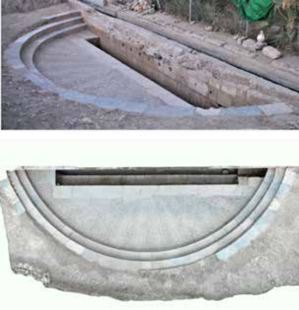
◀ Figura 5.- Fotografia de les restes del Poador del Pontet després de la seua excavació i ortofoto cenital (Sector I i Sector Ib).

Aquest conjunt arquitectònic estaria format principalment per tres cossos. En primer lloc, un gran depòsit rectangular d'1 metre d'amplària per aproximadament 40 metres de llargària, on es contindria l'aigua que abastia la font. D'aquest depòsit, que estaria format per carreus de pedra tosca molt ben treballada, sortirien 12 brolladors o xorros a la part central (dels 40 metres de llargària) de la façana oest, pels quals, sortiria l'aigua cap a un segon depòsit, una xicoteta bassa o piló situada baix el nivell de sòl, també rectangular, i de 9 metres de llargària per aproximadament mig metre d'amplària. Al voltant d'aquesta basseta o piló es disposarien els altres dos elements que conformarien el conjunt arquitectònic del Poador del Pontet.