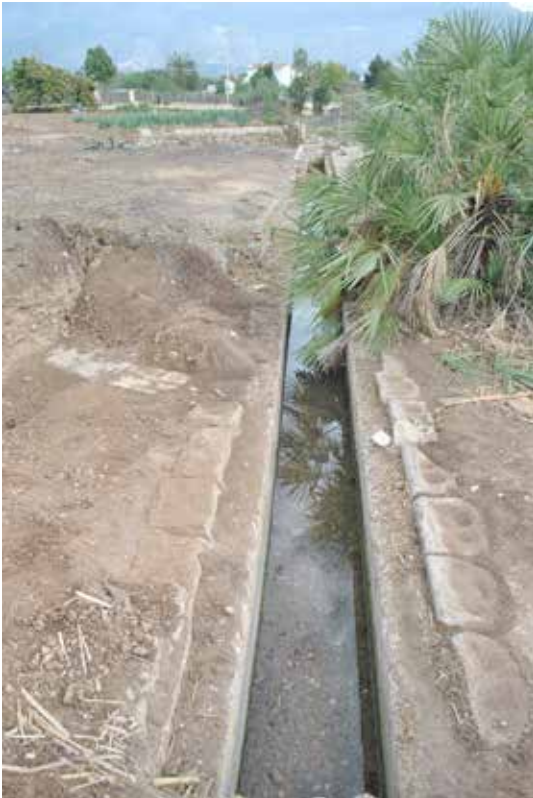
◀ Figura 2.- Fotografia del moment de la troballa arqueològica.

Si bé és cert que aquest topònim havia estat recollit en la bibliografia local, mai no s'havia cercat més documentació al respecte ni hi havia notícia alguna de la seua existència i ubicació. Serà a l'any 2013 quan es planteja per primera vegada una hipòtesi al voltant de la localització del Poador del Pontet i en 2015, quasi coincidint amb la troballa arqueològica, apareix per primera vegada publicada aquesta hipòtesi sobre la existència i ubicació del Poador del Pontet (Martín 2015, 61).