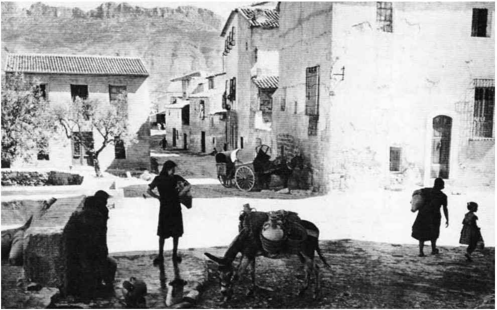
▲ La plaça de la Creu, 1940.