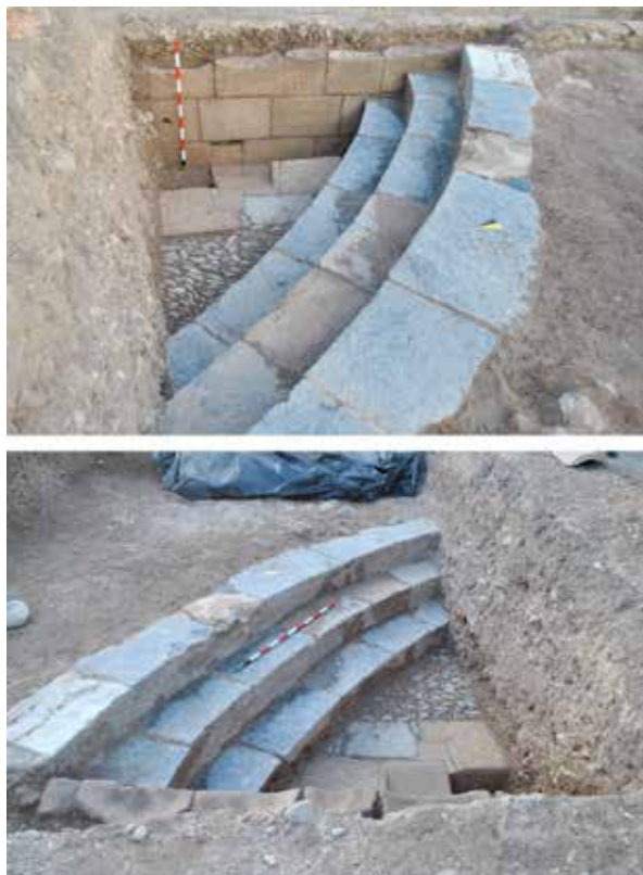
◀ Figura 4.- Fotografies del Sector I una vegada finalitzada la primera campanya d'excavació arqueològica.

I, centraria el principal focus d'atenció de les investigacions al trobar-se disposat en el punt on havien aparegut les restes arqueològiques. L'excavació d'aquest sondeig, efectivament, suposà el descobriment de part de la estructura que fou detectada durant la troballa arqueològica.